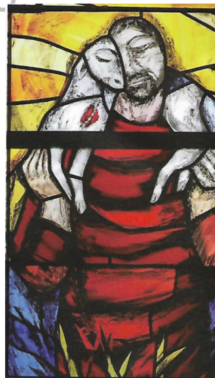
Ovce svoje zove imenom... Sieger Köder: Krist, Dobri pastir.

Zborna molitva Svemogući vječni Bože, dovedi nas u društvo nebesnilca: nek stado tvojih vjernih, makar skromno, prispije onamo kamo ga predvodi hrabri Pastir. Po Gospodinu.