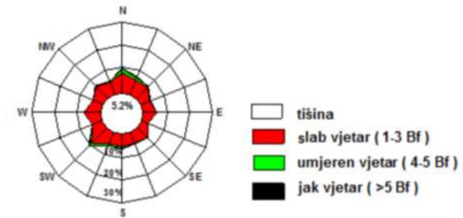
Slika 2: Godišnja i sezonske ruže vjetra, Čakovec, 1993–2000.

U posljednjih 15 godina na području Općine Donji Kraljevec nije bila proglašena el. nepogoda uslijed olujnog nevremena.