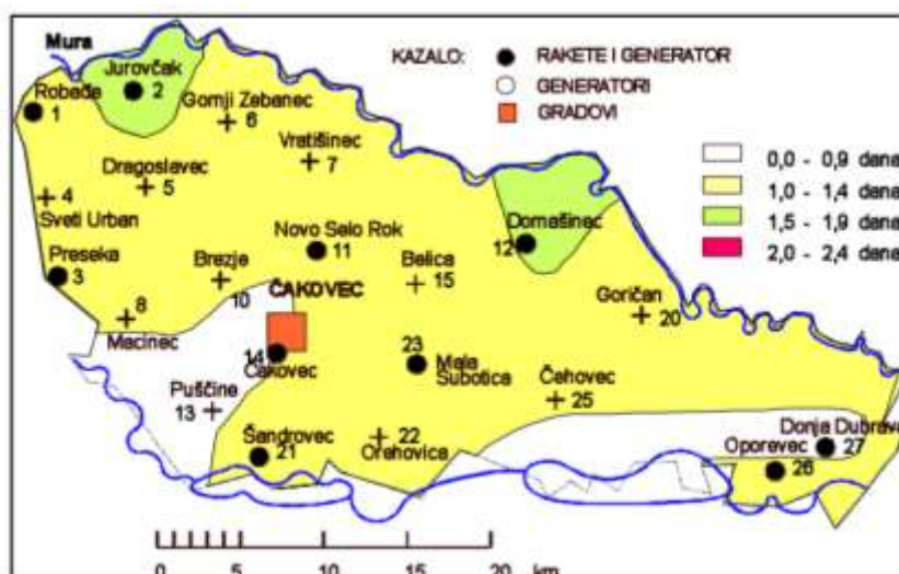
Slika 3: Prostorna raspodjela srednjeg broja dana s tučom i/ili sugradicom za vrijeme sezone obrane od tuče. Međimurske županija, 1981.–2000.