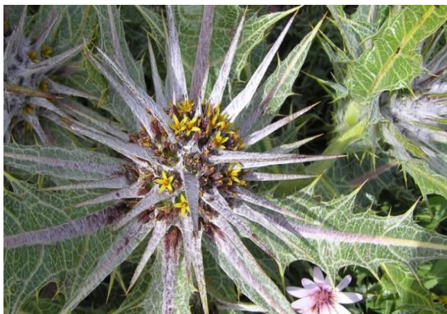
Ovo je biljka od koje su Isusu ispleli trnovu krunu Pelud ove biljke pronađena je na Torinskom platnu!

SRETAN USKRS SVIM NAŠIM ŽUPLJANIMA,ŽELI ŽUPNIK SA SURADNICIMA.