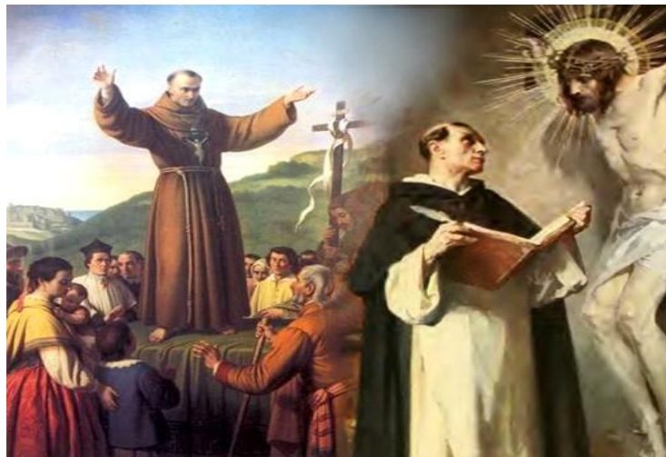
Sv. Leonard z Porto Maurizio (1676 - 1751)